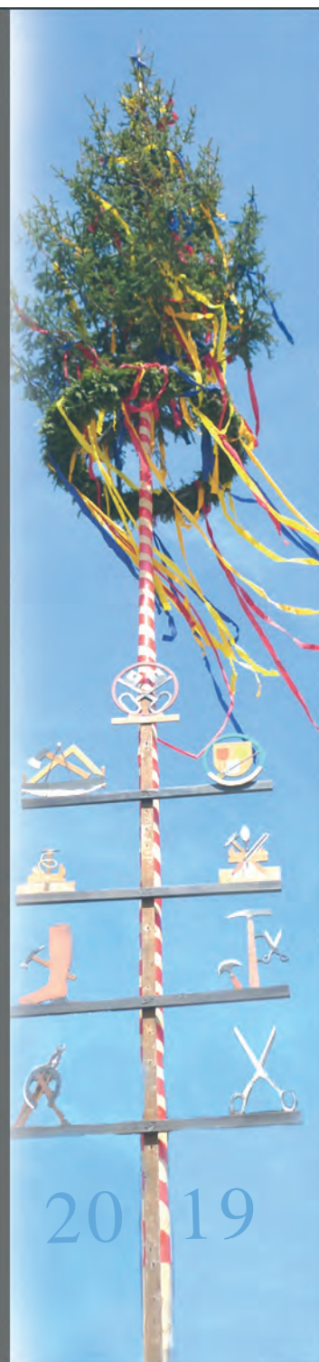
Uwe Morgenstern Bürgermeister