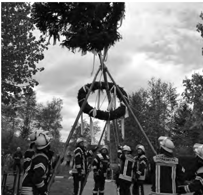
Die Feuerwehr stellt traditionsgemäß wieder den Maibaum am 18er Grün des Golfclubs auf.

Es sind nicht alle Symbole des Maibaums, die auch auf den Golfclub zutreffen. So sagt der Brauch, dass es Elemente des Wachstums, der Fruchtbarkeit, des Aufbruchs und der Auslösung böser Mächte sind. Aber auch Symbole der Freude und des Glücks, sowie der Gemeinschaft von Gleichgesinnten und Freunden.