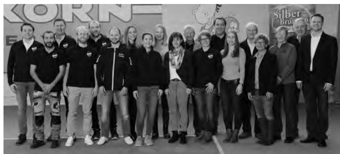
Das Funktionsteam des TSV